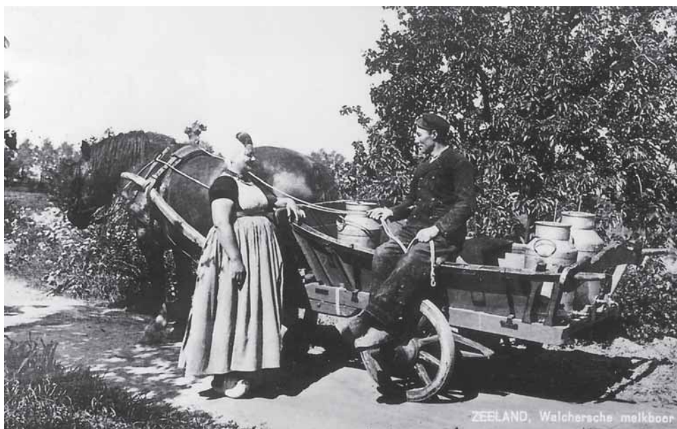
ZEELAND, Walcherse melkboer