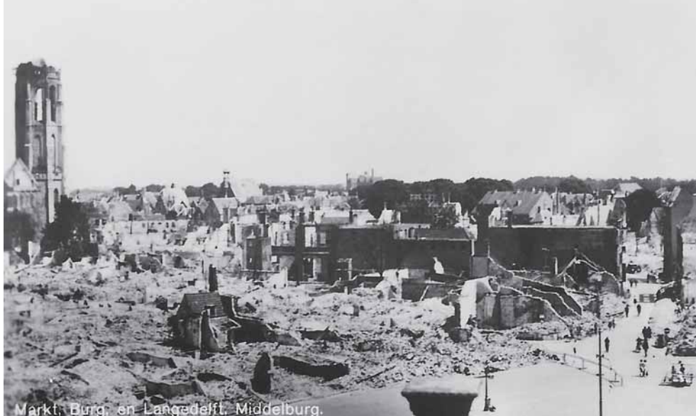
Markt, Burg, en Langedelft, Middelburg.

Middelburg na 'Zwarte Vrijdag', 17 mei 1940. Het stadshart in puin.