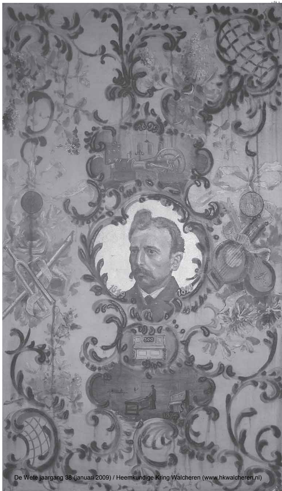
De Wete jaargang 38 (januari 2009) / Heemkundige Kring Walcheren ( www.hkwalcheren.nl )