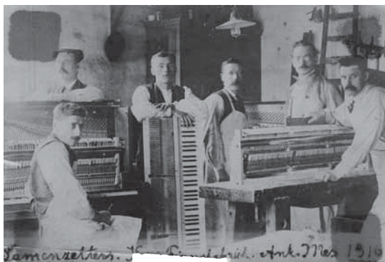
Samenzetters (?) in de pianofabriek van Antoine Mes, 1916.

stoommachine. Het kunstwerk hangt bij een kleindochter van Mes, die aan de Pottenmarkt woont in Middelburg (zie pag. 28). Ondanks deze positieve berichten had Mes rond 1900 te lijden onder de concurrentie van Duitse pianobouwers. In 1902 noemde ook het gemeenteverslag van Middelburg de toestand van de pianohan-