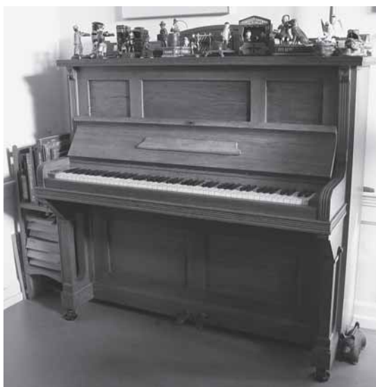
Een originele Mes-piano (Mes-van Lokven, Middelburg).