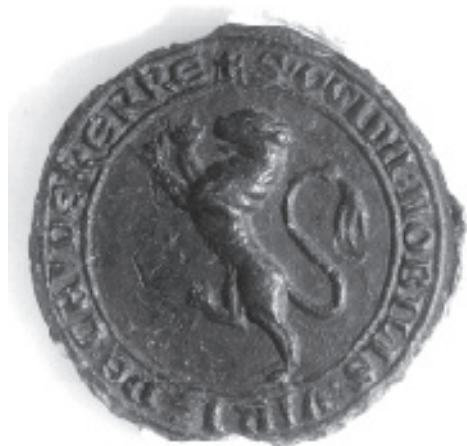
Zegel van Gillis van Koudekerke, hangend aan de oorkonde van 1258. Vertaling randschrift: zegel van de edelman van Koudekerke (Rijksarchief in Zeeland, Archief OLV-Abdij regest-nr. 43).

Waar, zoals bij Willem het geval is, sprake is van mannen van de graaf, worden daarmee leenmannen bedoeld. Ze waren er in