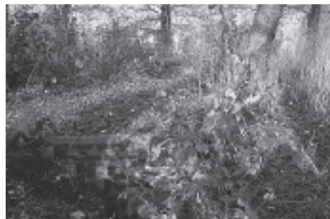
De boveningang van de kelder ligt goed verscholen in het struikgewas. Op de achtergrond huize De Sprencq aan de Seissingel.