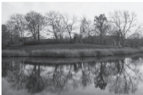
Van de buitenkant is niet te zien dat onder dit gedeelte van het Middelburgse bolwerk de restanten liggen van een ijskelder

van 19 oktober 1887 aan J.J. Bal verleende concessie om uit een 250 centiare groot wateroppervlak van de vest nabij zijn ijskelder ijs te verzamelen. Dit voorstel werd door de gemeenteraad zonder beraadslaging of hoofdelijke stemming aangenomen. De raad had er ook geen enkele moeite mee dat burgemeester en