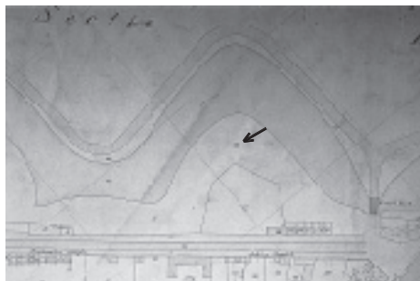
De locatie van de ijskelder op de kadastrale minuutplan van Middelburg sectie A, 1873

mineraalwateren en limonades. Koninklijke erkenning verkreeg hij in 1875 toen het brevet Hofleverancier aan hem werd toegekend door koning Willem III. Vanaf dat moment zien we het wapen van deze koning op Bals rekeningen prijken. Banketbakkers gebruikten natuurijs voor het maken van roomijs en voor het koel