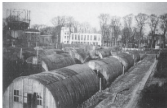
Het kamp van de Duitse mijnopruimers op het Molenwater te Middelburg. Op de achtergrond de gasfabriek en de stadsschouwburg, ca. 1946. (Stichting Geschiedkundige Verzameling Explosieven Opruimingsdienst)

De bewakers moesten verhinderen dat de Duitsers vluchtten. Ontvluchtingen werden krijgstuftelijk bestraft. De discipline werd door de Duitse commandant naar Duits militair recht gehandhaafd. De straffen