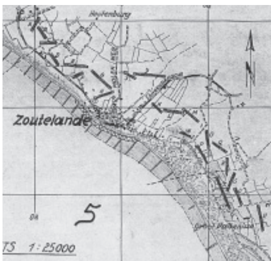
De ligging van de mijnen in het mijnenveld Dromedar rondom Zoutelande.

gers, reservisten, oud-leden van de ondergrondse, enzovoorts. In januari 1946 meldde een kapitein na een bezoek aan het 1ste en 2de Regiment Infanterie te Middelburg: "Discipline laat te wensen te over, exercitie gaat niet goed, kleding slecht, administratie een chaos en moreel laag." Het rapport was misschien wat gear-