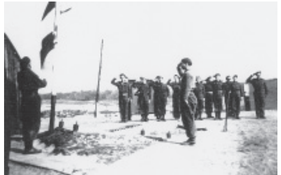
Vlaggenparade in het kamp Oranjezon, voorjaar 1946.

dan zeggen. Op den duur regende het klachten. In maart 1946 stuurde de burge-meester van Grijskerke een telegram naar Defensie: heel Walcheren dreunde, huizen stonden te schudden, pas ingezette ramen gingen aan diggelen. Hij verzocht om maatregelen. Defensie antwoordde dat het niet altijd mogelijk was zodanig te rui-