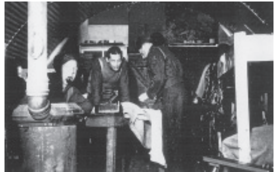
Interieur van de romneyloods in kamp Oranjestad, voorjaar 1946.

Het moreel der gevangenen was slecht. Sommige Duitsers dreigden zichzelf in de