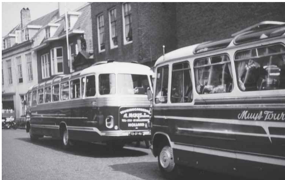
Met twee autobussen anderhalve dag op reis naar de Friesche Vlag in Leeuwarden, omstreeks 1952.

leveranciers werden reclameprijzen vastgesteld, die werden gepubliceerd in veertiendaagse folders. Ook kwam er elke week een advertentie in De Faam . De inkoopvereniging deed het goed; steeds meer producten werden ingekocht.