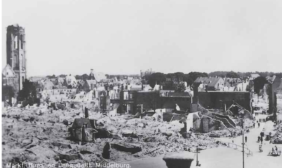
Middelburg na 'Zwarte Vrijdag', 17 mei 1940. Het stadshart in puin.