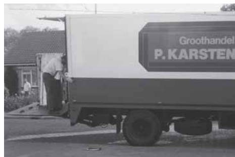
Groothandel P. Karsten BV, opvolger van Iveko uit Noord-Brabant, bevoorraaide elke vrijdag.

ling bij Campina elke dag doorgeven. Een Iveko-vertegenwoordiger kwam wekelijks op bezoek en nam bestellingen op. Later moesten deze zelf doorgebeld worden. Vergaderen was niet meer nodig. Wel voor het bestuur, dat voor overleg met de andere verenigingen uit het Zeeuwse (Walcheren, Zeeuws-Vlaanderen, Zuid-Beveland)