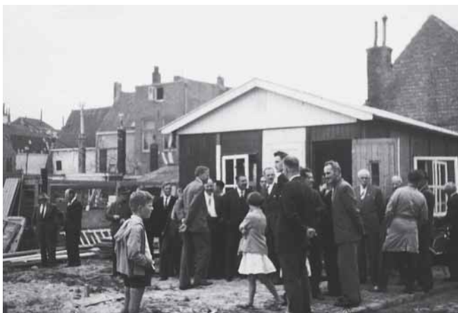
Belangstellenden op de dag van het heien van de eerste paal van de nieuwe melkfabriek aan de Walensingel.

De voorzitter stelde voor op zoek te gaan