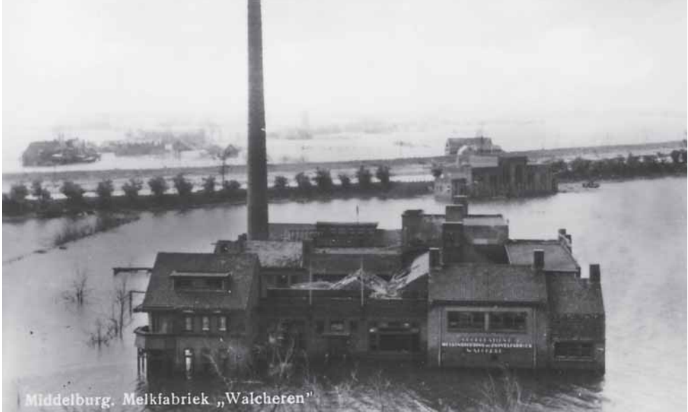
Middelburg. Melkfabriek „Walcheren”

wel gestandaardiseerd, dat wil zeggen dat het vetgehalte standaard op 3,5 procent was gebracht. De handel werd ook uitgebreid met Friesche Vlag-producten, zoals koffiemelk. Ook Nutricia kwam hiermee, plus diverse soorten babyvoeding. Iedere melkwijk lag verspreid over de stad; de melkventers reden kriskras door Middelburg. Er waren straten waar wel tien leveranciers per dag verschenen. Dat was niet efficiënt, maar men was dit gewend en men wilde ook eigenlijk niet anders. De burger was vrij om te kiezen en de melk-