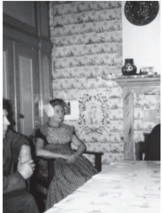
Een deel van de woonkamer van de hofstede Molenhof. Afgebeeld is het linkerdeel van de schoorsteen met tegelplateau. Op dit plateau is het portret van Wilhelmina van Pruisen afgebeeld. Haar man, koning Willem I, stond op de rechterzijde afgebeeld.