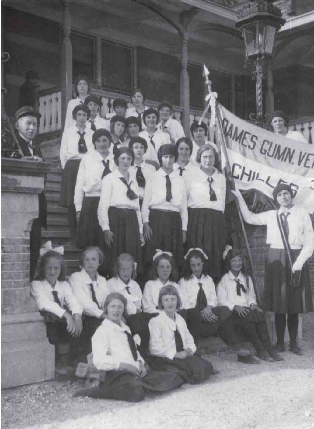
Dames en meisjes van Achilles poseren in Domburg, 18 juli 1925.