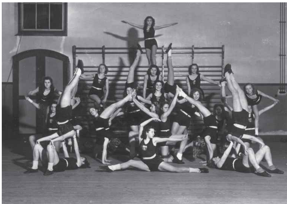
Turnsters poseren in een door Bal geregisseerde opstelling, 15 februari 1948.

Alhoewel mijn gezin zwaar getroffen was, bleven mijn gedachten ook steeds bij de vereniging en ik gaf de moed niet op. Ik nam contact op met de K.N.G.V., die mij direct alle mogelijke gegevens over de vereniging verstrekke en door tussenkomst van de Middelburgsche Courant kon ik met