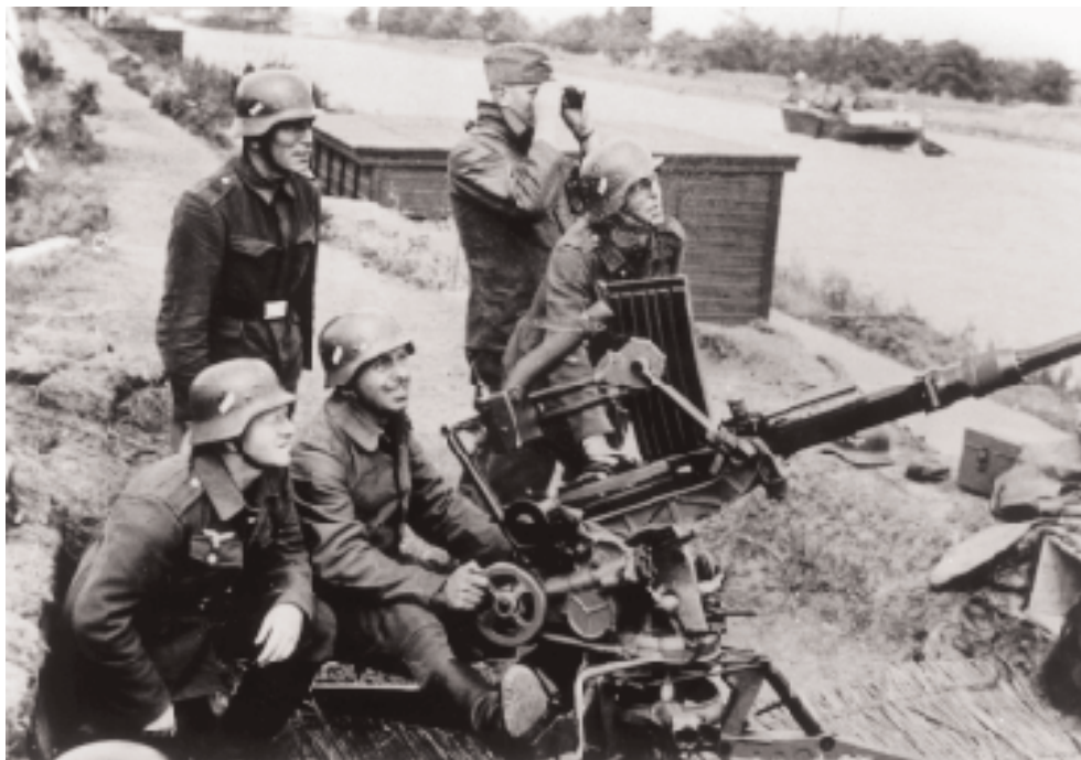
Duits M/M Flak (Flugzeug Abwehr Kanone) op het jaagpad bij de zwemschool te Vlissingen, ca. 1943

We bleven een aantal maanden in Westkapelle en bouwden nog een aantal barak-