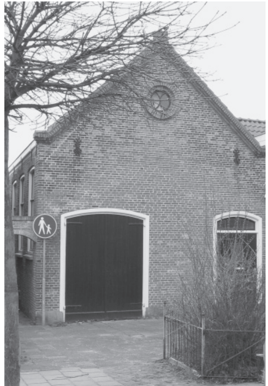
De karspuit van de brandweer van 't Zand was tot 1926 gestald in het Evangelisatiegebouwtje van de Hervormde Gemeente 't Zand, in 't Vuile Bresje (Kerksteeg).

satieplannen te bespreken. Ook op 't Zand werd een twaalfstal personen aangesteld. De personele organisatie was nu rond. 't Zand beschikte echter niet over een motorpomp, men had nog een brandspuit die met de hand bediend moest worden. Daarom werden nog twee ploegen van twaalf man aangesteld om hand- (!) en spandien-