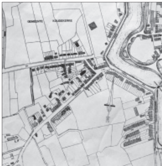
't Zand, afgebeeld op de plattegrond van Middelburg, 1925. (Zeeuws Archief, Zeeuws Genootschap, Zelandia Illustrata deel I nr. 327)

Gezien de grote hoeveelheid briefjes van