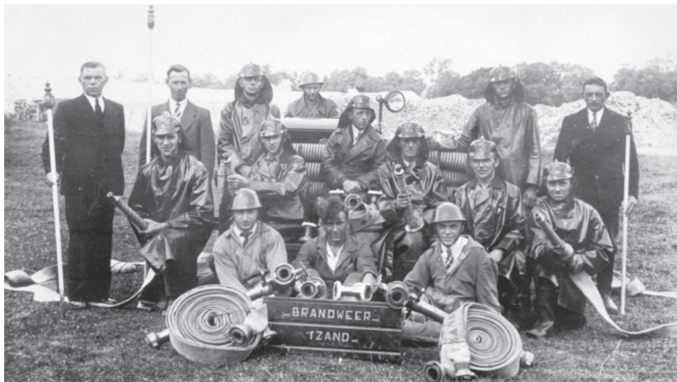
Het brandweerkorps van 't Zand in 1941.

Zoals het een goede commandant betaamde, gaf de opperbrandmeester B. en W. regelmatig een overzicht van de activiteiten. Hij rapporteerde op 18 december 1938 het volgende: "30 October 1937 – een oefening gehouden met de spuit in het Bosch van Torenvliet, welke twee uur geduurd heeft. 22 November 1937 – een