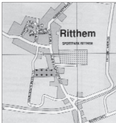
De Louwerse's Wegeling op het Falkplan van Middelburg en Vlissingen.

Toen ik daar in het voorjaarszonnetje zat uit te rusten, nog onder de indruk van de 362 knotwilgen die ik had geteld, werd ik ineens wat onrustig. Wordt dit mooie weggetje soms ook in zijn bestaan bedreigd? Tot mijn geruststelling las ik later in het Dorpsplan Ritthem 2002-2006 dat de cultuur-historische waarde van de wegeling