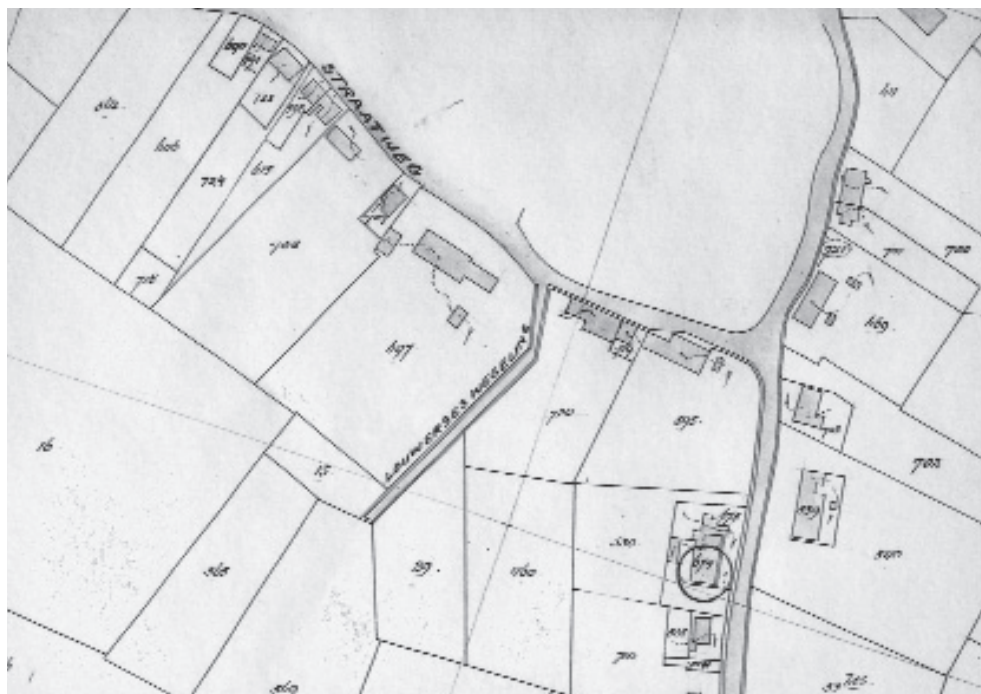
De Louwerse's Wegeling op de kadastrale kaart van 1940. (Ritthem sectie C, Zeeuws Archief, Kadasterplans, cat.nr. 5897)

Ik ben nog op zoek gegaan naar de herkomst van de naam van deze wegeling. Louwerse is een veel voorkomende familienaam op Walcheren. De wegeling zal in