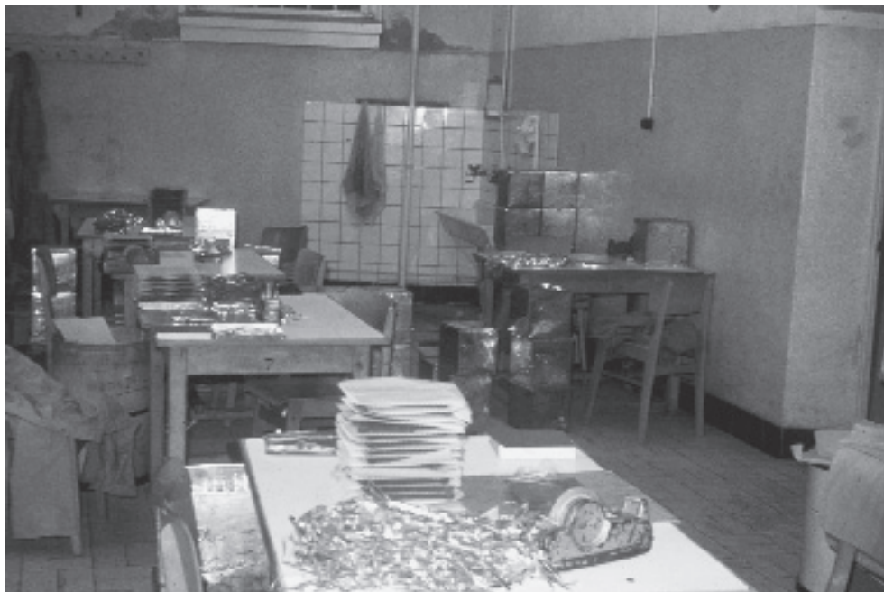
De werkzaal, ca. 1965.

ten allemaal weer opgelapt worden, hetgeen kapitalen kostte. Toen de schrijver van dit artikel de staatssecretaris hierop aansprak, kreeg hij gelijk. Maar hij kreeg ook te horen dat het politieke tij niet te keren was geweest... in die tijd.