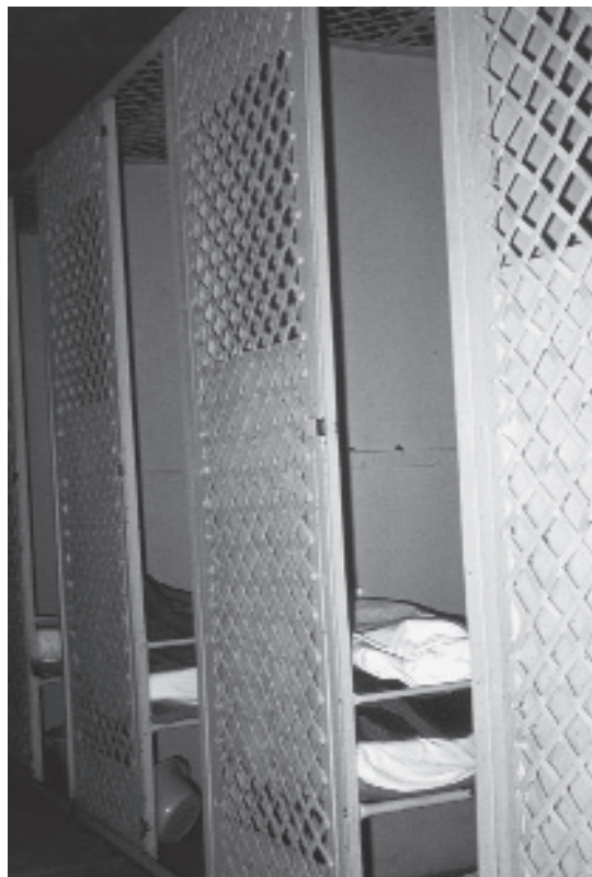
Slaapkooien (chambrettes), ca. 1965.

Eind jaren zestig, begin jaren zeventig wer-