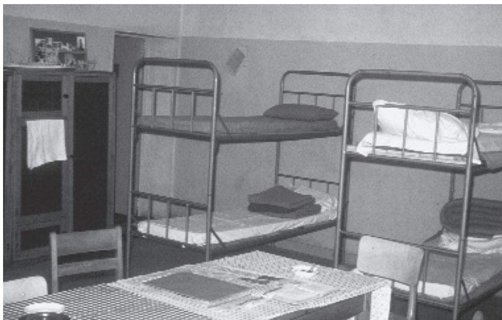
De hechteniszaal voor zes personen, ca. 1965.

Volgens artikel 65 moesten de gevangenen maandelijks een voetbad nemen en voorts een geheel bad “zoo dikwijls de geneesheer zulks zal voorschrijven”. De straffen waren niet kinderachtig. Artikel 103 luidde: “De gevangene op water en brood zal anderhalf ratio brood ontvangen.” Artikel 104: “De straf op eene zware over-