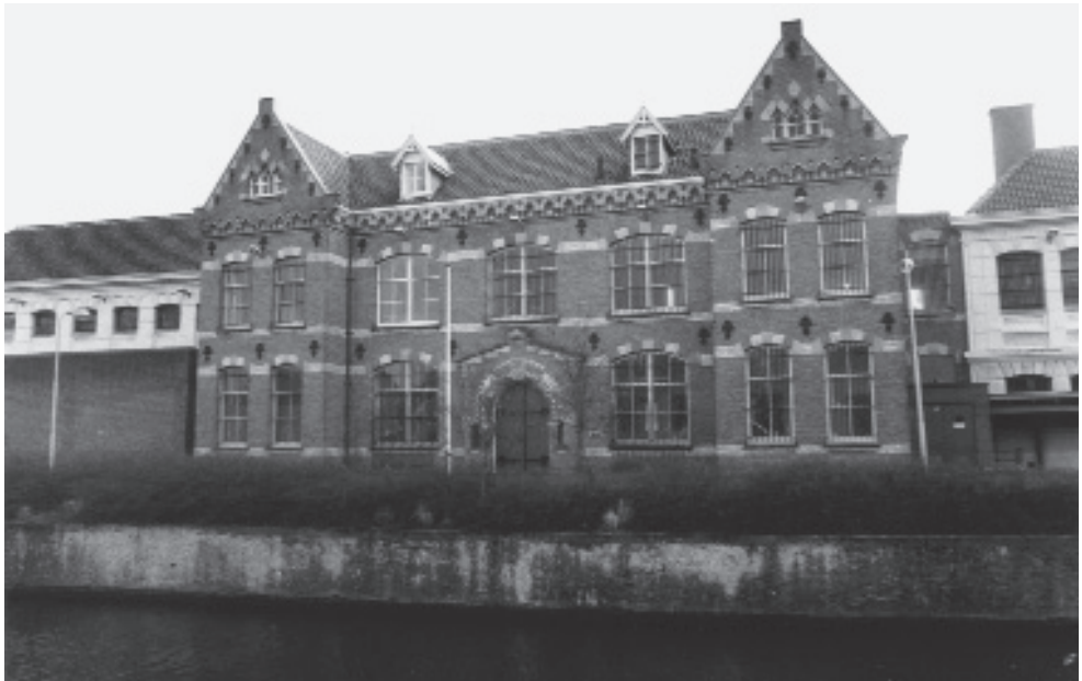
Het Huis van bewaring in maart 1993, twee maanden voor de sloop.

opgemaect volgens de overgegeven bestecken en daarvan rapport te doen.” Er werden ook een ontvanger en vier regenten voor de twee volgende jaren benoemd. De verbouwingskosten waren voor die tijd erg hoog. Ondanks de gift van 200 pond, de opbrengst van de leprozengoederen en de uiteindelijk toch gehouden loterij, wer-