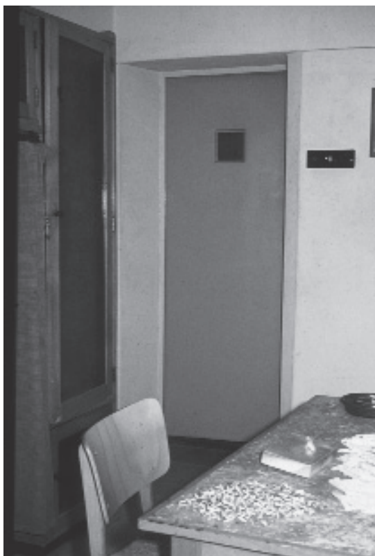
Cel in het huis van bewaring, ca. 1965.

jaar traktement ingehouden wegens “zorgeloosheid in het bewaren der gevangenen”. Daaraan zal de wijn wel schuld hebben gehad! Op hoogtijdagen zoals kermissen en “wanneer aldaar eenige executie geschiedde”, werd aan de gevangenen een extra hoeveelheid wijn verstrekt. De binnenvader moest er ook op toezien