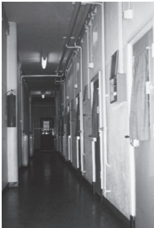
De gang van de westleugel, ca. 1965.

blanke kanne”. Uit een rapport van 1806 blijkt dat de binnenvader in dat jaar nog steeds vrijstelling van accijns genoot. Er werden ook feestmalen aangericht. Over een diner in het tuchthuis op 14 april 1758 werd het volgende geschreven: “In Tugthuijs gegeten, Ik soon en dogter Radermacher en juff. Nieuwveld. Burge-