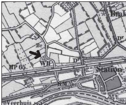
De galgenberg afgebeeld op de topografische kaart van 1912.

van Arnemuiden (13 maart 1601). Hij was afkomstig van Gent, een allochtoon dus, zouden we nu zeggen.