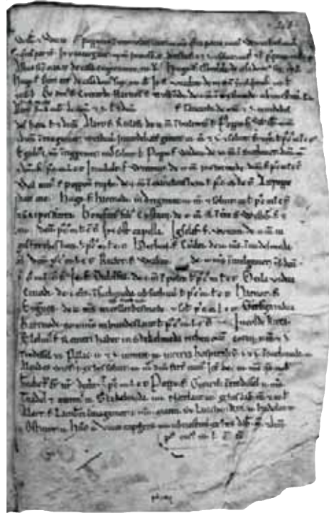
Folio 266 recto uit de lijst van Echternach. (Fotografische reproductie IV, bijlage bij het artikel van Tack in Archief Zeeuws Genootschap , 1939)

heeft het instituut een verzameling van 240 duizend veldnamen (waarvan het Walcherse aandeel slechts 2,5 procent bedraagt). Het instituut wil deze namen digitaliseren. Men is bezig met een proefproject om voor de provincie Noord-Holland ook de kaarten te digitaliseren (dat heet vectoriseren), het zogenoemde Divena-project.