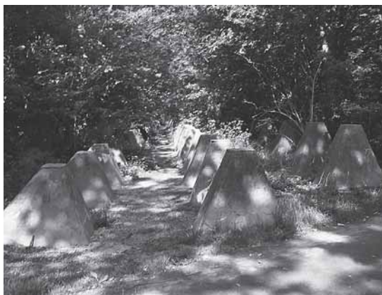
Klein Valkenisse. Restanten van de tankver-sperring in de Atlantikwall, aangelegd door de OT.

Bouwplaatsen en kampen werden bewaakt door zgn. Schutzmäner, vaak geüniformeerde en bewapende WA-mannen. Ver-