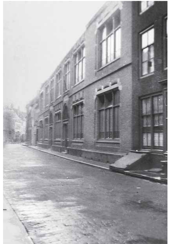
Middelburg. De school aan de Singelstraat was OT-Lager.

Einsatzgruppe West zetelde in Parijs. Daaronder vielen onder andere de Ober-