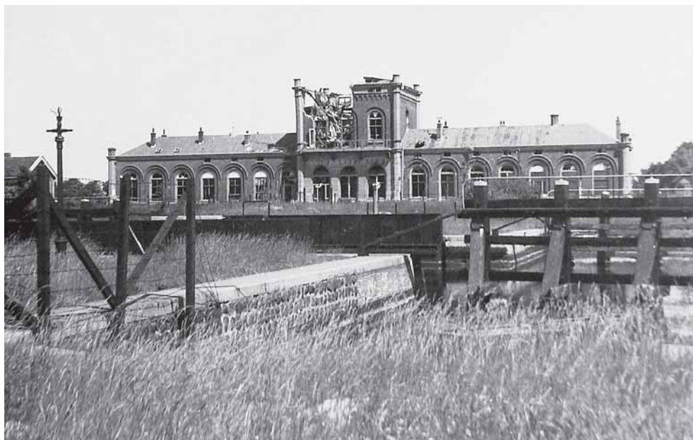
Vlissingen. Het verwoeste spoorwegstationsgebouw was OT-Lager.

Aan werk was geen gebrek: gevechts-, manschappen- en munitiebunkers, mitrailleurkasten, prikkeldraadversperringen,