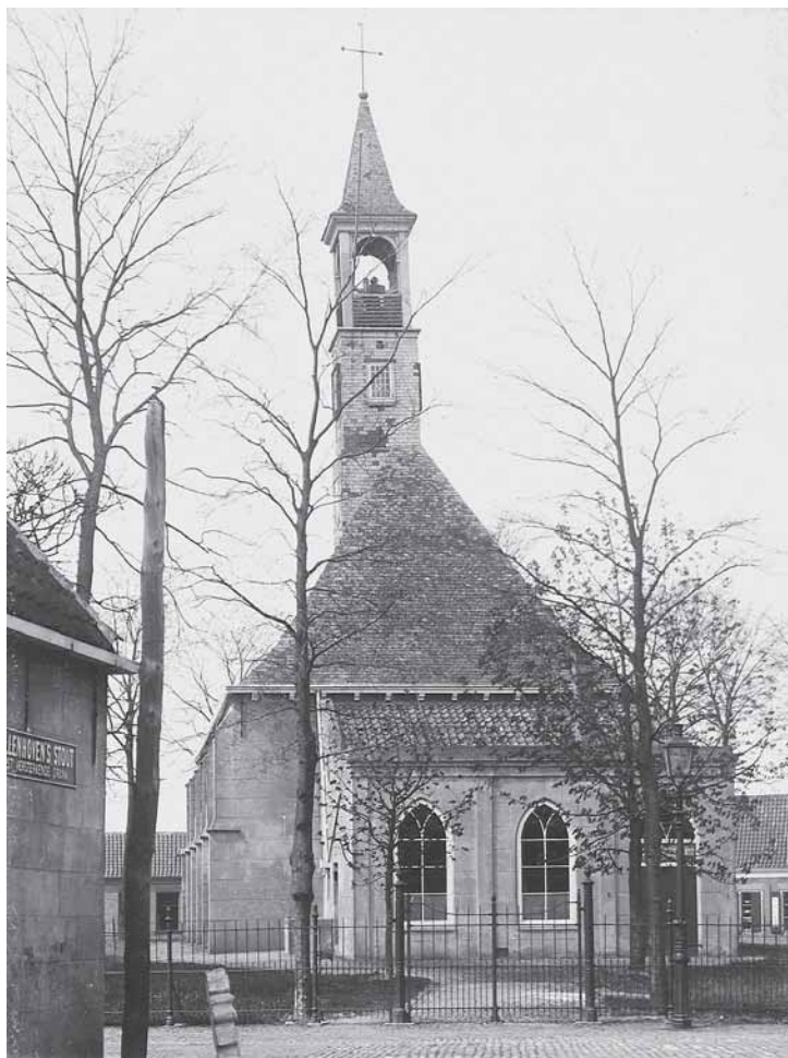
De hervormde kerk met de consistorie, gezien vanuit de Brouwerijstraat, voor de verbouwing van 1911.

ten betreffende de grond van het spuihuis en de gevangenis werden beschreven als burgerlijk eigendom. Ondanks het feit dat deze situatie al sinds 1827 bestond “was het er nooit van gekomen om dit notarieel vast te leggen.” Het kerkbestuur had in zijn welwillendheid de grond ter plekke ooit geschonken en het gemeentebestuur was