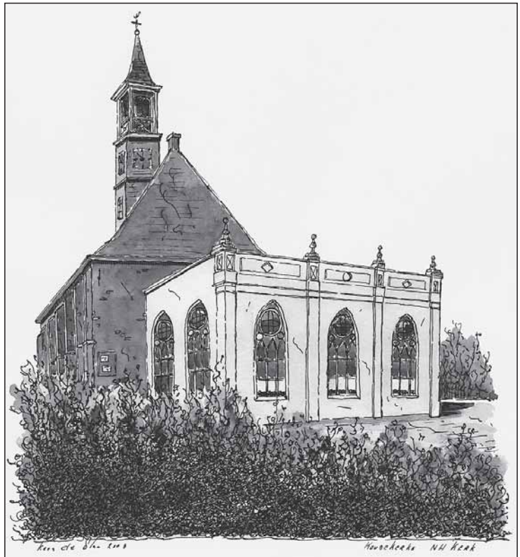
Pentekening van de hervormde kerk met de witte consistorie door Kees de Plaa, 2003. (Zeeuws Archief, Zeeuws Genootschap, Zelandia Illustrata, collectie-De Plaa, cat.nr. ZI-PLAA-2501)

ken verdween. Het blauw van de pilasters en ornamenten was in de vijftig jaar ervoor al verdwenen. Niet verwonderlijk, want kort na de nieuwbouw ervan, in 1911, brak de Eerste Wereldoorlog uit, daarna volgden de crisisjaren en de Tweede Wereldoorlog, de inundatie van Walcheren en de wederopbouw. Vanuit die optiek waren er andere