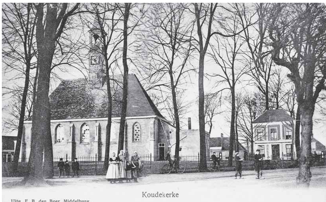
Uitg. F. B. den Boer, Middelburg.

son (gevangeniscel) aangebouwd. Uit die tijd moet ook de uitdrukking "jij belandt nog eens onder den toren" dateren. Dat werd je als kind in de jaren vijftig nogal eens aangewreven wanneer je betrapt was bij het bogeren of als je ander ontoelaatbaar gedrag vertoond had. Of het een uitsluitend plaatselijke uitdrukking was, is mij niet