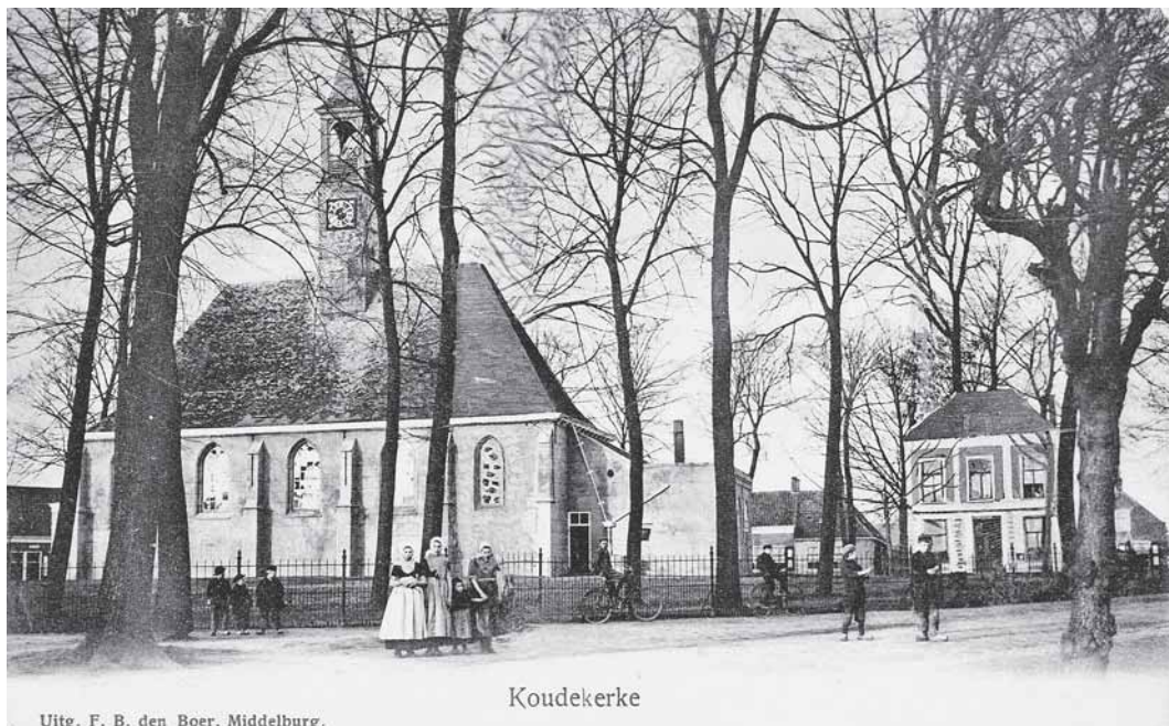
Uitg. F. B. den Boer, Middelburg.

son (gevangeniscel) aangebouwd. Uit die tijd moet ook de uitdrukking "jij belandt nog eens onder den toren" dateren. Dat werd je als kind in de jaren vijftig nogal eens aangewreven wanneer je betrapt was bij het bogeren of als je ander ontoelaatbaar gedrag vertoond had. Of het een uitsluitend plaatselijke uitdrukking was, is mij niet