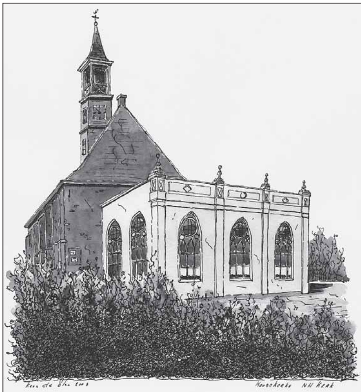
Pentekening van de hervormde kerk met de witte consistorie door Kees de Plaa, 2003. (Zeeuws Archief, Zeeuws Genootschap, Zelandia Illustrata, collectie-De Plaa, cat.nr. ZI-PLAA-2501)

ken verdween. Het blauw van de pilasters en ornamenten was in de vijftig jaar ervoor al verdwenen. Niet verwonderlijk, want kort na de nieuwbouw ervan, in 1911, brak de Eerste Wereldoorlog uit, daarna volgden de crisisjaren en de Tweede Wereldoorlog, de inundatie van Walcheren en de wederopbouw. Vanuit die optiek waren er andere