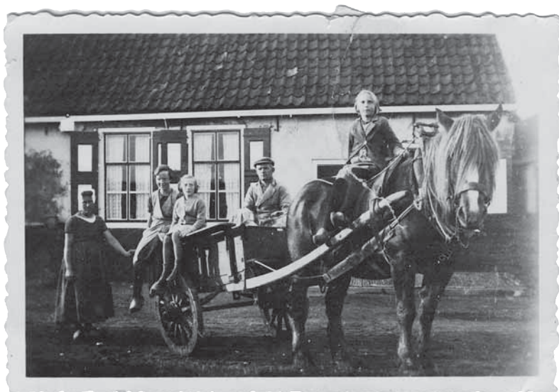
De familie De Visser voor hun boerderij. Beide ouders en drie kinderen. Het jongste kind was nog niet geboren. (collectie familie De Visser)

Op die plek staat nog steeds een boerderij Zwanenburg, maar dan daterend van de twintigste eeuw. Ook in de buurt van Oost-Souburg bevond zich een gelijknamige boerderij.