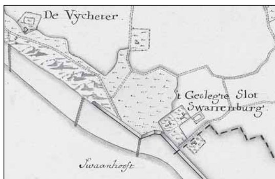
Zwanenburg op de kaart van Walcheren van de Hattinga's, ca. 1750. (Zeeuws Archief, Atlas Hattinga Zeeland, deel I, nr. 16)

sen 1635 en 1638, maar baseerde zich op oud materiaal. De kaart vertoont namelijk de situatie van Zeeland uit de periode 1598-1615. De Overloper van de Westwatering uit 1622 bevestigt dat in de periode ervoor een aantal kleinere percelen werd