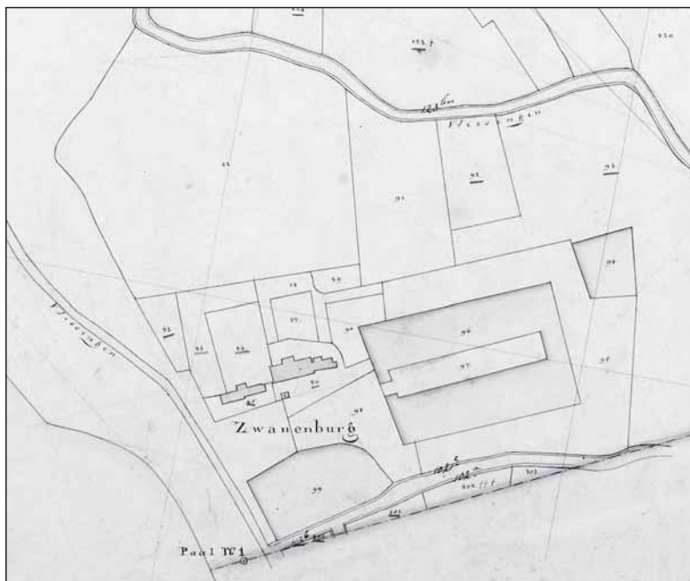
Hofstede Zwanenburg op de kadastrale minuutplan Koudekerke sectie G.