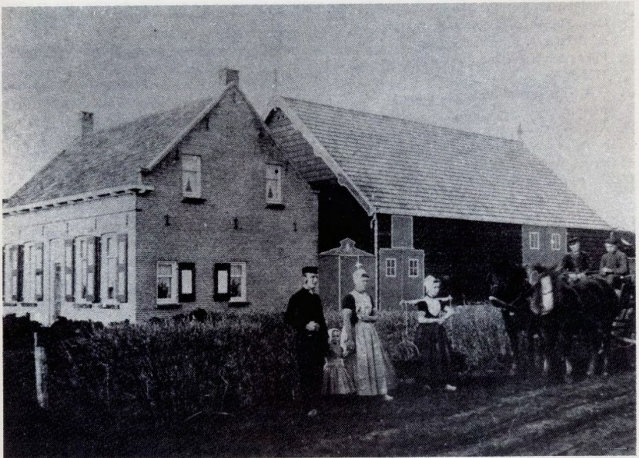
Boerderij "Maldegem", voorheen Hogeweg 175, Vlissingen.