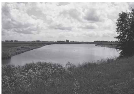
Het Schenge.