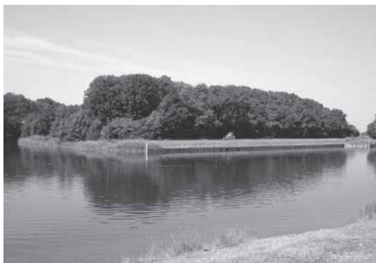
Het eiland De Omloop bij De Piet.

Het gebied dat wij nu Oranjeplaat noemen, beslaat het recreatieterrein en enige landbouwpercelen. Het gebied tussen de twee kreek die door het Noord-Sloe lopen, wordt heden ten dage Calandpolder genoemd. Je zou het geheel kunnen beschouwen als een groot buitendijks gebied. Een van de krekken vormt de scheidslijn tussen genoemde plaat en polder. Er zijn maar weinig landkaarten die duidelijkheid verschaffen over de naam van deze kreek. Zelfs topografische atlassen van Zeeland geven geen uitsluitsel. Na enig speurwerk in documenten van Rijkswaterstaat en de provincie blijkt het te gaan om