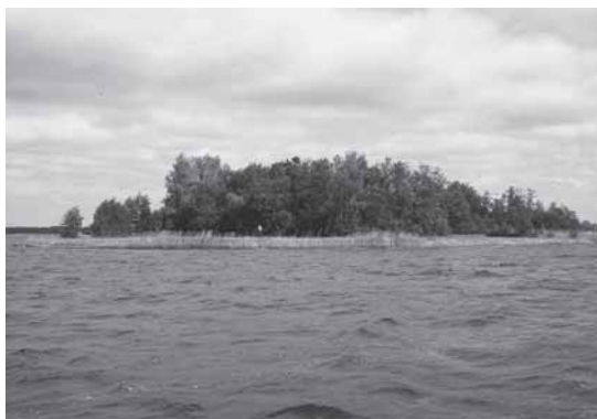
De Arneplaat in het Veerse Meer.

De Soelekerkeplaat heeft zijn naam te danken aan de ambachtsheerlijkheid Soetelincxkerke of Soelekerke. Dit gebied, waar de invloedrijke ambachtsheer de lakens uitdeelde, lag op Noord-Beveland. Tijdens de Sint-Felixvloed van 1530, die de geschiedenis inging als Sint-Felixquade saterdach, is het dorp Soelekerke