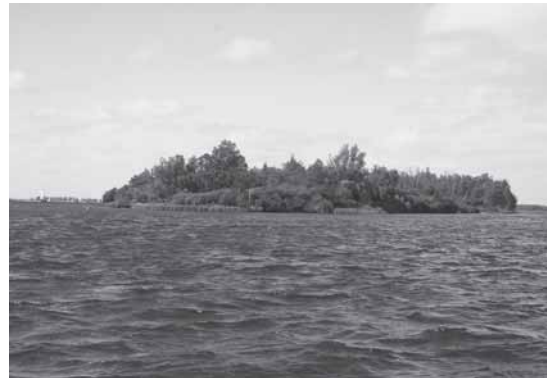
Het Aardbeieneiland in het Veerse Meer.

Het recreatieterrein Oranjeplaat is in de loop der jaren uitgegroeid tot een jachthaven met daarbij een restaurant, een camping en een hotel. In het voorjaar van