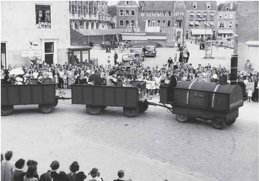
Het treinstel dat aan de optocht deelnam.

Ter elfder ure moest juist het deel van de route naar die wijk, door het slechte wegdek van de Seissingel, geschrapt worden. Die van 't Zand waren natuurlijk hevig teleurgesteld. De kwestie werd opgelost door de route te laten lopen via de Langevielesingel, de Koudekerkseweg en de Poelendaeleweg.