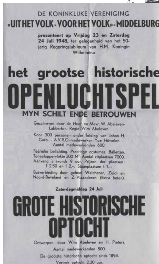
Affiche van het Openluchtspel. (Zeeuws Archief, Archief Vereniging Uit het Volk, Voor het Volk, Middelburg, inv.nr. 28)

De enige dissonant op die avond was een weigerende microfoon, waardoor het ge-