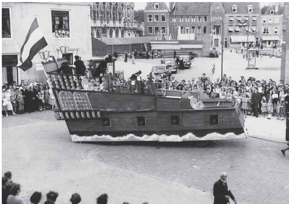
Het koopvaardijship, een van de indrukwekkende deelnemers aan de optocht.

den enkele kanttekeningen geplaatst: het eerste deel vertoonde te weinig vaart en de dialogen waren vaak, net als de verhalen van de grootvader, te lang. Een enkele deelnemer sprak te zacht of vergiste zich in de tekst, maar andere spelers compenseerden dat weer door hun goede optreden.