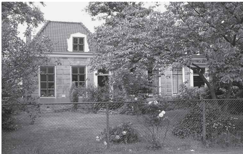
Het huidige Casa Cara aan de Oude Vlissingseweg.