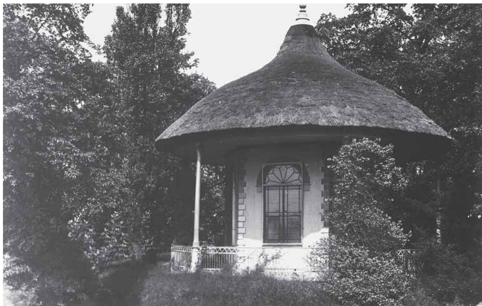
Theekoepel van buitenplaats Veldzigt.

Als we het gebied van Veldzigt en de brug over de watergang gepasseerd zijn, zien we links van de weg weer een buitenplaats, het al genoemde Welgelegen. Rechts van de weg ligt De Parel. Van beide landhuizen is echter maar heel weinig bekend. We weten alleen dat Wel-