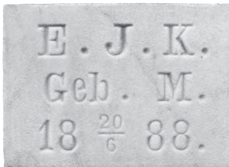
Gevelsteen in het middengebouw van het buitenverblijf Casa Cara.

Rechts van de weg zien we een groot herenhuis met onder aan de gootlijst de naam Casa Cara. Aan de rechterzijde van het complex bevindt zich het hoofdgebouw met een grote hoge voordeur en aan weerszijden drie grote ramen. Links staat een wat kleiner gebouw dat vermoedelijk