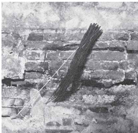
De bezem en de Goudse pijp die men in 1932 na het verwijderen van een houten betimmering in het Veerse stadhuis aantrof. (illustratie uit het tijdschrift ‘De Prins’ van 5 maart 1932)