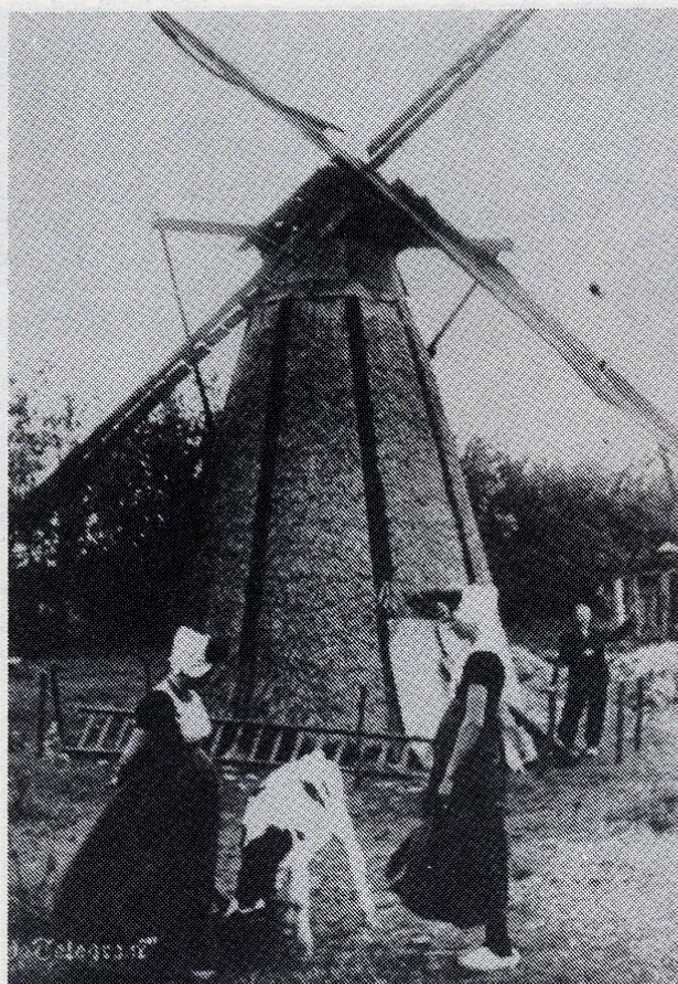
Deze foto is vanuit het oosten genomen. Rechts zien we Jaap Geelhoed, links zijn vrouw Ma Geldof. In het midden staat Ké Ova, de meid, die in het huisje rechts van het hof woonde. Rechts zien we de travalje en de schoorsteen op de smidse.