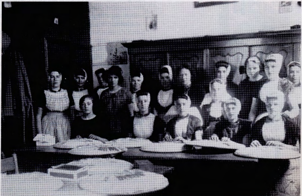
De Westkappelse kantklas

De patronen worden door haar in kloskant uitgevoerd en al doende ontstaat een unieke en waardevolle documentatie over wat ooit bedoeld was als bron van inkomsten voor meisjes en vrouwen uit gezinnen die dat hard nodig hadden. Simpel gezegd werd in Nederland kant gemaakt als hobby door dames van goeden